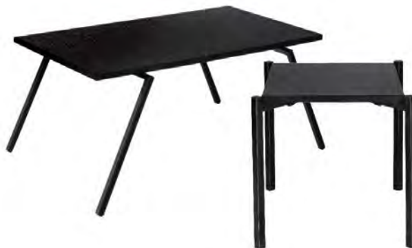
BLACK COCKTAIL TABLE 115103