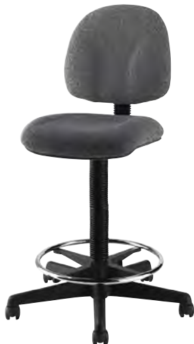
GREY GASLIFT CHAIR 71045

Telescoping height adjustment; five-caster base rolls with ease. Base à cinq roulettes et ajustement télescopique de la hauteur.